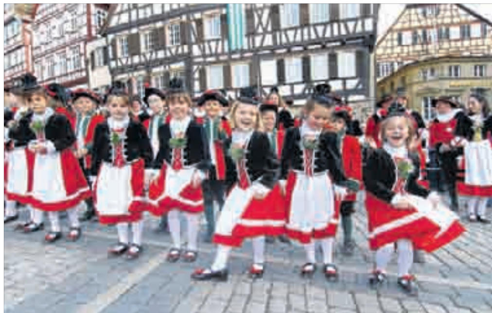
Die kleinen Sieder haben Spaß auf dem Haller Marktplatz.

Der Samstag, 11. Juni, beginnt mit dem Lagerleben auf dem Grasbödele um 14 Uhr. Um 14.30 Uhr treten dort Fahnschwinger aus Jette, einem Vorort von Brüssel in Belgien, auf. Die 15-köpfige Gruppe Draposmaaiter ist beim Fahnschwingertreffen in Öhringen zu Gast und