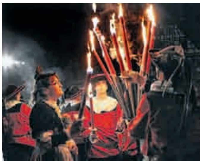
Ein Bild, das es in diesem Jahr erst spät gibt: Da das Kuchen- und Brunnenfest in diesem Jahr spät gefeiert wird, ist es zu Beginn des Fackeltanzes möglicherweise noch nicht ganz dunkel.

Alle Siedersfamilien und Mitglieder des Vereins Alt Hall werden gebeten, die grün-weißen Siedersfahnen aufzuhängen. Bei Bedarf gibt es neue Fahnen bei Ehrensieder Reinhold Elbel.